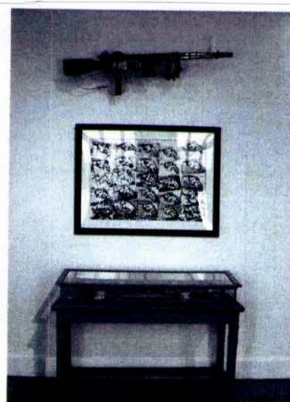
Vue de l'exposition Bang ! Bang ! au Musée d'Art et d'Industrie de Saint-Etienne, 2006.