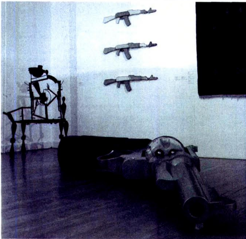
Vue de l'exposition Bang ! Bang ! au MAI, 2006. Au premier plan une œuvre de Philippe Perrin, Gun , 2002.

6. Comme sur la plupart des cartels de l'exposition, on n'a, concernant Export, que la mention d'un titre, d'un artiste et d'une date.