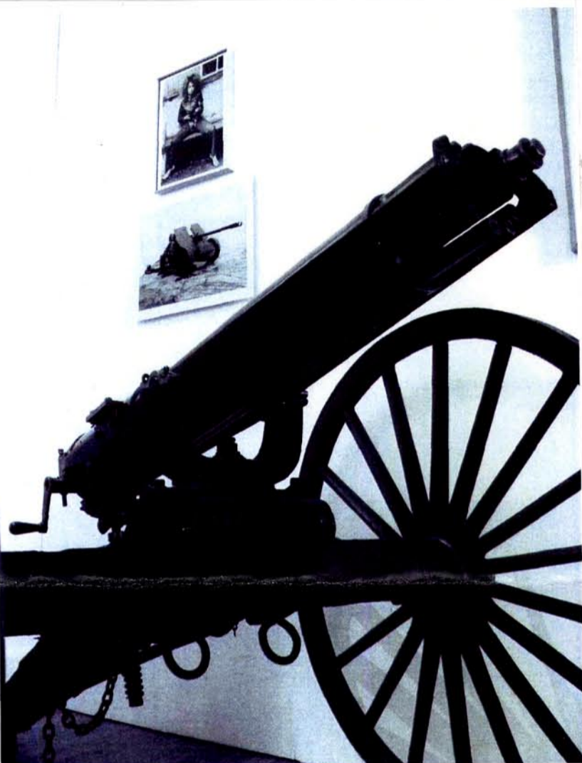
Vue de l'exposition Bang ! Bang ! au Musée d'Art et d'Industrie de Saint-Étienne, 2006.