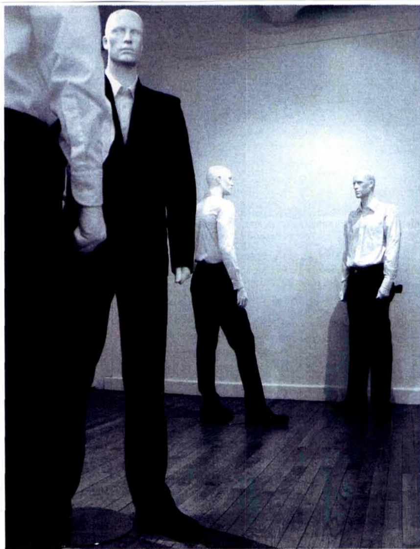
Alain Declercq, Costumes - holster , 2006.

5. Cf. A. Moles, Psychologie du kitsch. L'art du bonheur , Denoël, Paris, 1971. Pensée réactivée par Jean-Yves Jouannais dans sa postface de Des Nains, des jardins , Essai sur le kitsch pavillonnaire, Paris, Hazan, 1999, p. 105 : « Le kitsch est un principe de dissolution de l'altérité, en même temps que le moyen de faire savoir et de revendiquer cette dissolution ».