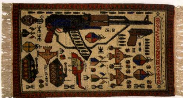
Tapis Kalachnikov Michel Aubry, 1985