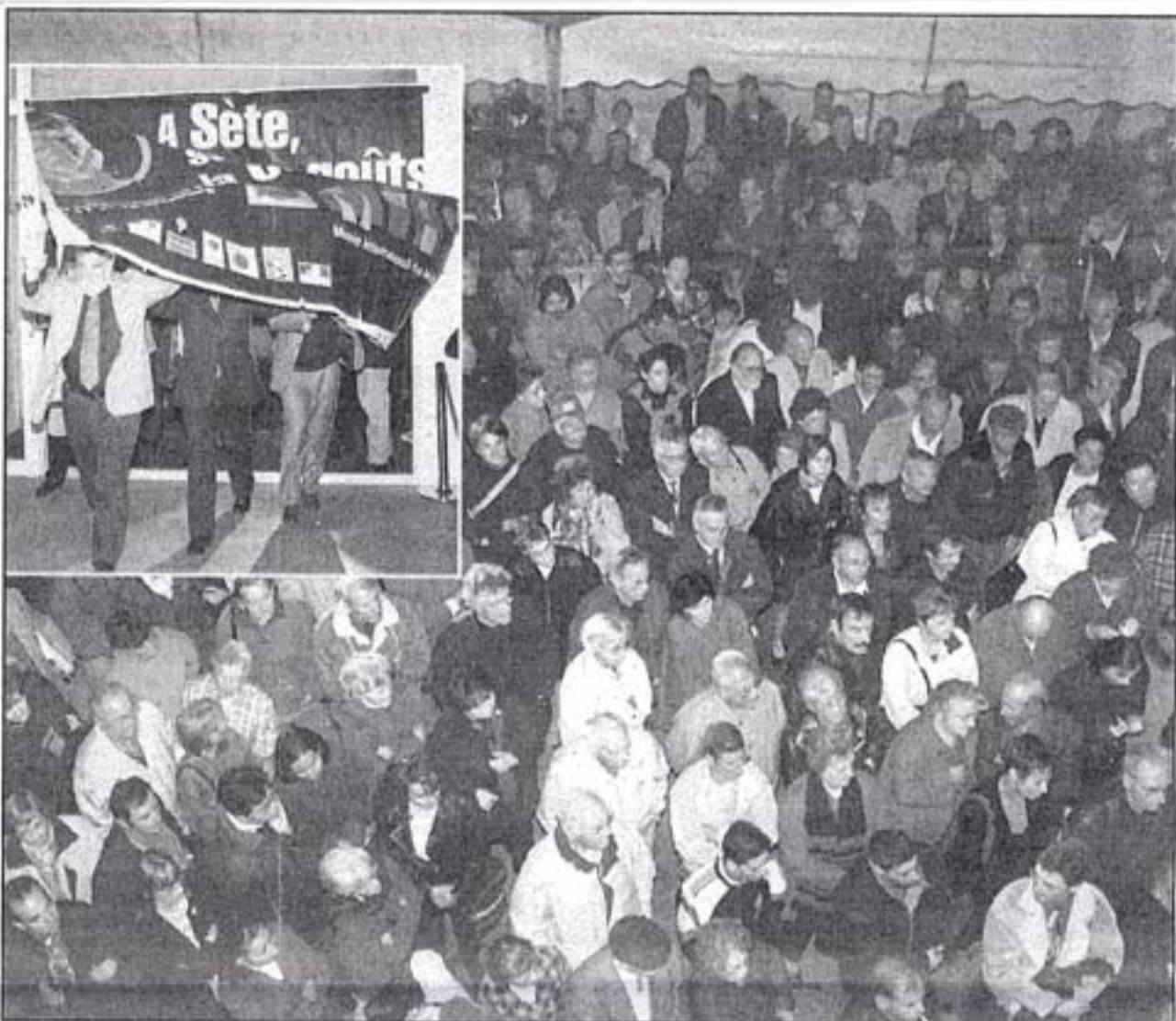
MIAM, MIAM... QUEL SUCCES POPULAIRE. On en a dit des choses sur ce Miam et pourtant, la foule était là. Plusieurs centaines de personnes étaient venues, hier soir, pour assister à l'inauguration de ce musée pas comme les autres. Même les huiles étaient là : le Député-maire de Sète, le président du Conseil Général, le Préfet, le président de la mission 2000 en France et le président du Conseil Régional. Certains diront que ce Miam est un peu « cul cul la praline » mais après tout un bon petit délire, sans aucune adjonction chimique, cela ne peut pas faire de mal, surtout pas au cul terreux.