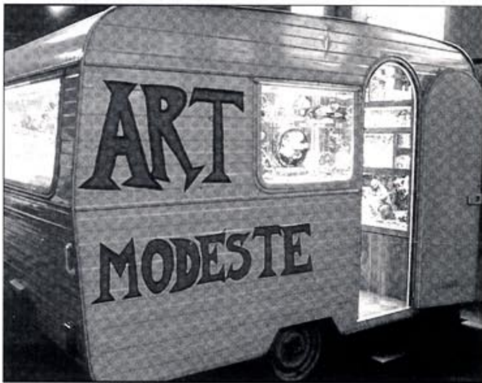
La caravane de "Art Modeste".

Créée en 1991 par Hervé Di Rosa et Bernard Belluc, l'Association de l'art modeste avec sa volonté de réunir comme un patrimoine des objets quotidiens, préfigurait le musée actuel : le Musée international d'art modeste. Son inauguration est prévue pour le mois de Novembre.