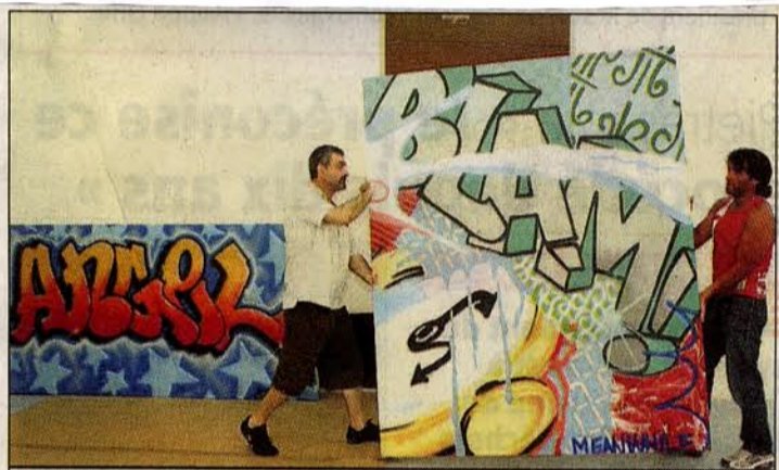
Au musée Paul-Valéry, lors de l'accrochage.