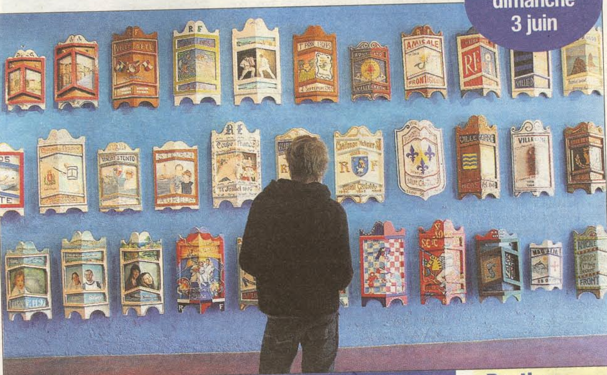
Les initiateurs de l'exposition au Miam ont fait appel aux anonymes comme aux collectionneurs passionnés ainsi qu'à quelques artistes parisiens mis à contribution.

Des artistes parisiens sont mis à contribution. « Cette exposition est une manière de réévaluer une culture populaire, une tradition locale très ancrée à Sète. On le fait à notre façon, d'une manière toujours transversale, dans un dialogue entre l'art populaire et les créa-