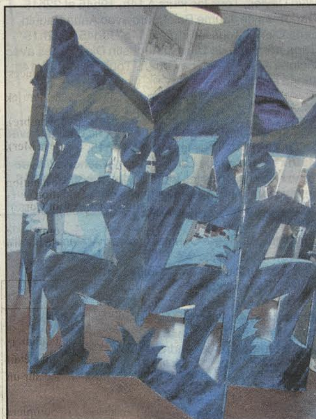
Les œuvres monumentales de Patrick Raynaud évoquent les pliages des livres d'enfance.

Jusqu'au 2 novembre au Miam, 23 quai Maréchal de Lattre de Tassigny, 04 67 18 64 00